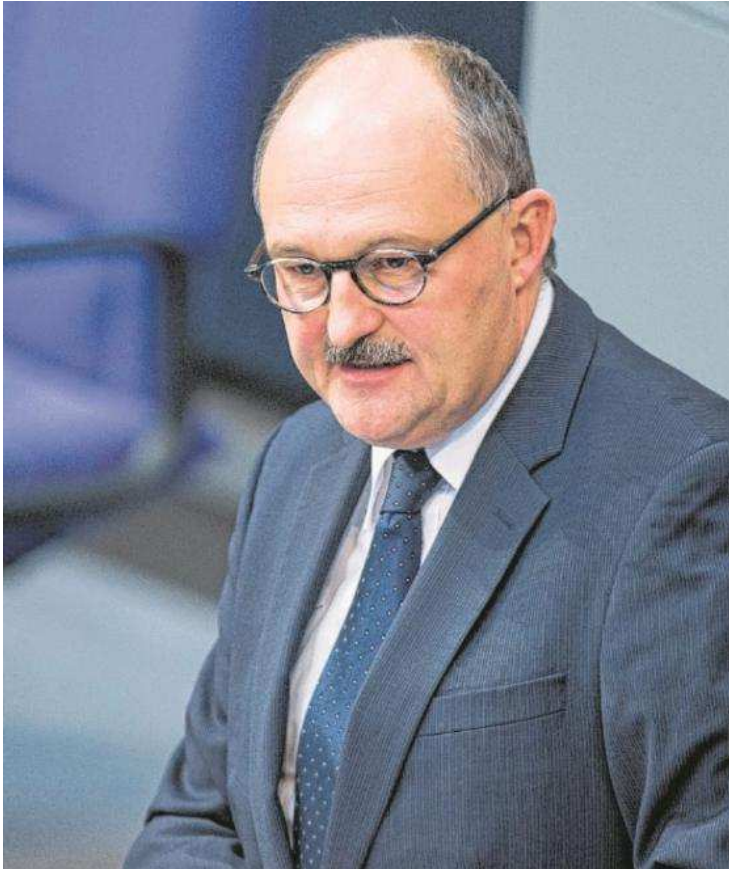
Michael Meister (55, CDU)

► Michael Meister (55, CDU), Diplom-Mathematiker, seit 1994 MdB, Wahlkreis Bergstraße, Parlamentarischer Staatssekretär im Bundesfinanzministerium.