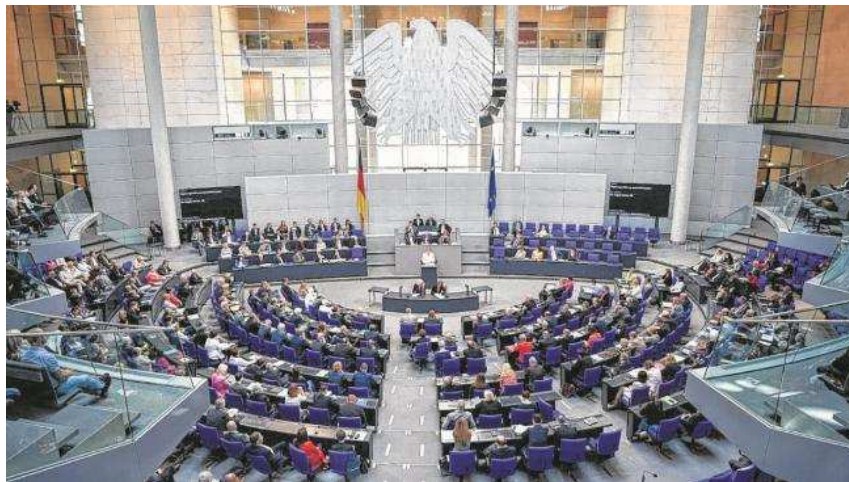
Der 18. Deutsche Bundestag ist am 22. Oktober 2013 zu seiner ersten Sitzung zusammengekommen