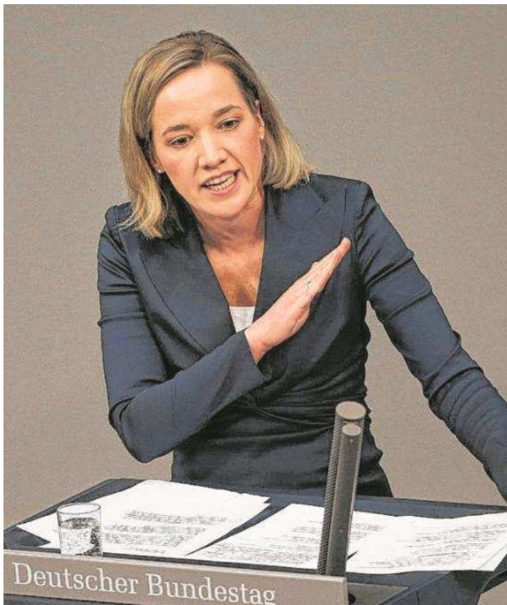
Kristina Schröder (38, CDU)

► Kristina Schröder (38, CDU), Diplom-Soziologin, seit 2002 MdB, 2009-2013 Bundesfamilienministerin, Wahlkreis Wiesbaden, Ausschuss für Wahlprüfung, Immunität und Geschäftsordnung, Ausschuss für Wirtschaft und Energie.