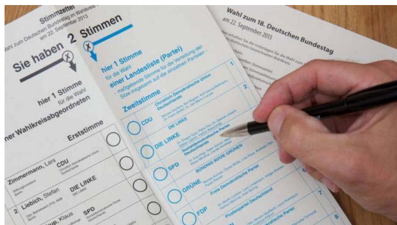
Zwei Stimmen hat jeder bei der Bundestagswahl am 22. September, die eine davon für einen Kandidaten aus dem Wahlkreis. Doch welcher von ihnen will am ehesten das, was mir wichtig ist? Der große Kandidaten-Check soll diese Frage beantworten