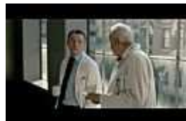
Hectors Reise oder Die Suche nach d...