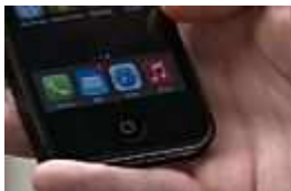
Geburtsgrüße: 30 Jahre E-Mail