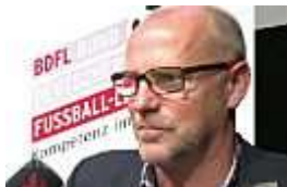
Schaaf: "Nationalspieler si...