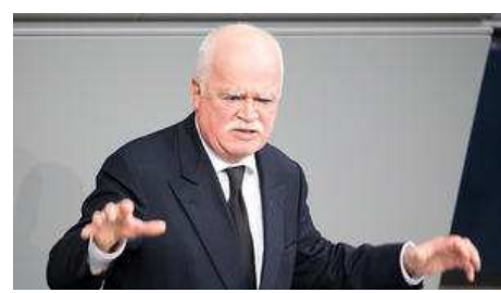
Seltener Anblick: Der CSU-Politiker Peter Gauweiler ist nicht oft im Bundestag

Verdient am meisten, fehlt am häufigsten Als erster Bundestagsabgeordneter hat der CSU-Politiker Peter Gauweiler in dieser Legislaturperiode mehr als eine Million Euro zusätzlich verdient. Gauweiler ist Rechtsanwalt und strich seit der Wahl 2013 mindestens 1.129.500 Euro zusätzlich ein, berichtet die Initiative 'abgeordnetenwatch.de'. Da Bundestagsabgeordnete ihre Einkünfte aus Nebentätigkeiten nur grob angeben müssen, liegen die tatsächlichen Einnahmen vermutlich noch deutlich darüber.