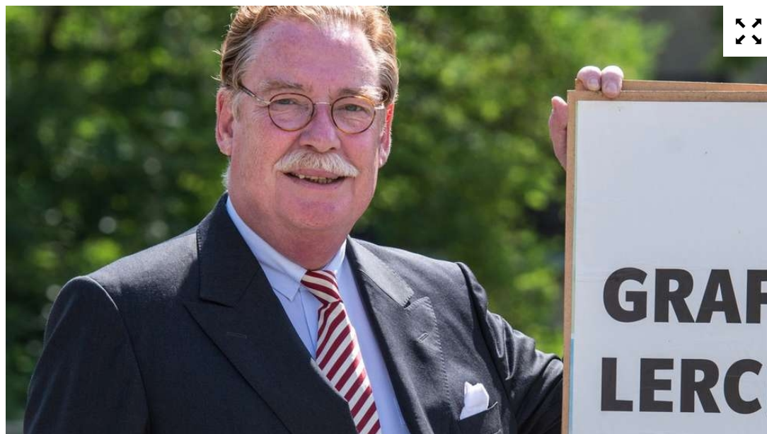
Philipp Graf von und zu Lerchenfeld (CSU).