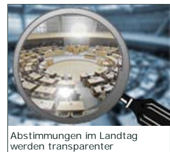
Abstimmungen im Landtag werden transparenter

Mit der Landtagslupe will WDR.de die im Landtag getroffenen Entscheidungen transparenter und nachvollziehbarer machen und einen direkten Informationsaustausch zwischen Bürgern und Abgeordneten ermöglichen: Sie verstehen nicht, warum der Abgeordnete aus Ihrem Wahlkreis der Fraktions-Disziplin entsprechend votiert hat, obwohl er doch wissen musste, welche Auswirkungen das für Sie vor Ort haben wird? Dann fragen Sie ihn! WDR.de kooperiert im Rahmen der Landtagslupe mit dem unabhängigen und überparteilichen Internetportal abgeordnetenwatch.de .