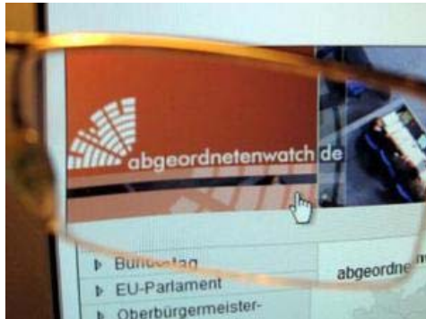
220 Direktbewerber können kontaktiert werden.

Schleswig-Holsteins Wähler können vor der Landtagswahl am 6. Mai ihre Kandidaten im Web befragen. Auf der unabhängigen Internetplattform abgeordnetenwatch .