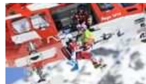
Höfl-Riesch stürzt – und gewinnt Weltcup