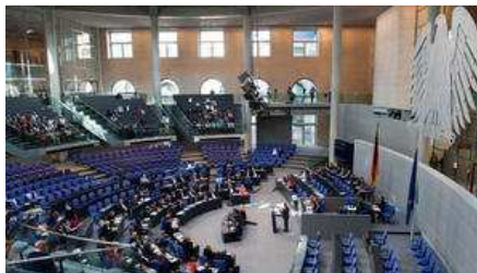
Der deutsche Bundestag: Nur einer von vielen Arbeitsorten für unsere Volksvertreter.